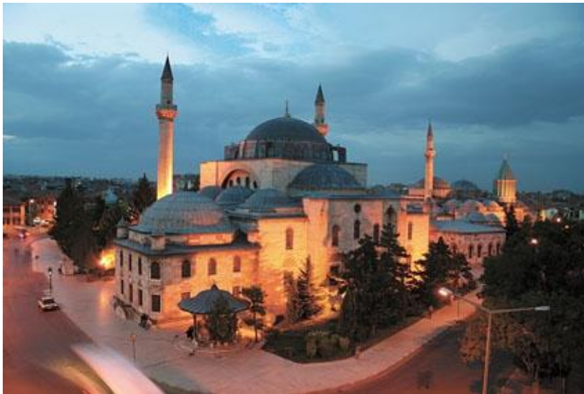
Muzeul Mevlana, complexul în care se află și mormântul lui Rumi

Ritualul, numit Sema, incepe cu o rugaciune cantata de dervisii condusi de un maestru. Samâ' (in araba: سماع, sema in turca) inseamna auditiie, dar si concert mistic, fiind legat de dansul dervisilor rotitori ("derves" se traduce sarac, cersetor in persana). Muzica este solemna, cu tonalitati stranii dar placute. Cu pasi lenti dervisii formeaza un cerc, apoi fac o serie de plecaciuni, unul catre altul si catre maestru, si ocolesc cercul de trei ori. In final, dervisii saruta mana maestrului si se avanta, pe rand, in dans. Fusta, cu deschidere ampla, se deschide si se rotește unduioș, impreuna cu dervisul. Rasucirea reprezinta si ea renuntarea la cele lumesti pentru a putea renaste intru Domnul. Dervisul isi deschide bratele si, foarte lent, ridica putin bratul drept si isi culca capul pe acel umar. Palma dreapta se desface spre cer pentru a primi binecuvantarea, iar cea stanga se intoarce spre pamant pentru a o transmite acestuia. Ritmul se inteteste, odata cu rotirea pentru a se opri apoi, brusc. Fascinatia dispare incet iar dervisii se pleaca din nou unul in fata celuilalt si parasesc, pe rand, locul unde au dansat.