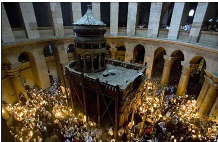
Biserica Sfântului Mormant – Noaptea Invierii

Lumina Sfânta - miracol al Ortodoxiei, apare in fiecare an de Pastele Ortodox la Ierusalim, in timpul Vecerniei Mari din Sambata Mare. Deasupra Sfântului Mormant se aprinde Sfânta Lumina, un foc care se pogoara din cer, manifestandu-se diferit in fiecare an si care in primele minute nu arde lucrurile cu care intra in contact.