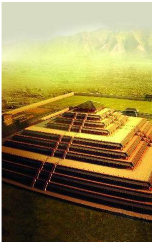
Stanga – soldati din teracota. Dreapta – presupusul mormant al imparatului Qin, probabil cea mai mare piramida construita vreodata, ingropata in prezent sub un deal. Jos – vedere din satelit.